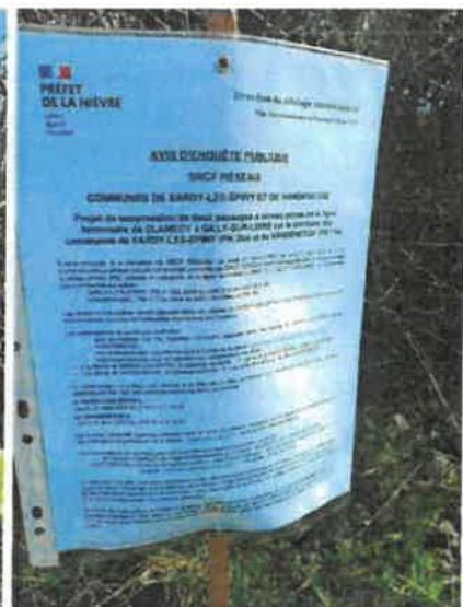
affichage de l'avis d'enquête