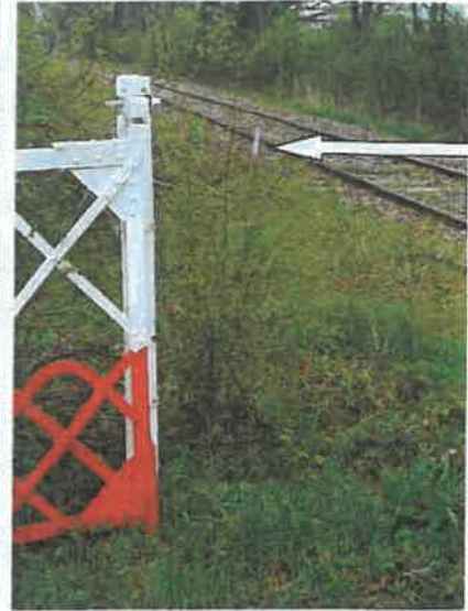
affichage de l'avis (PN 72 ??)