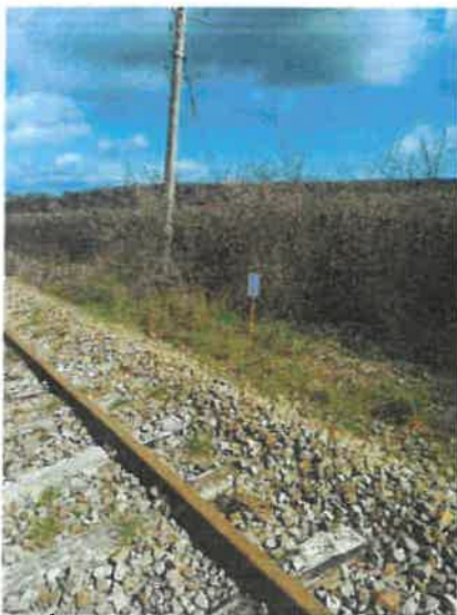
Vue générale du PN28a et accès

1- Accès au passage à niveau, remblai et absence de chemin carrossable de part et d'autre du PN28a