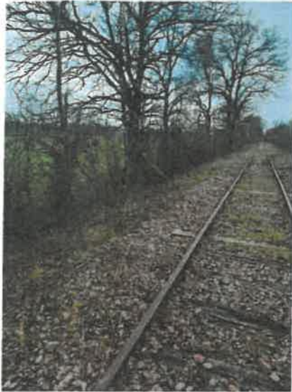
Environnement du PN 71 a depuis la voie